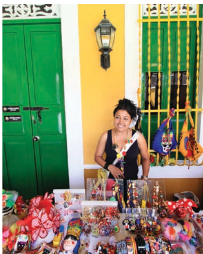
Calles coloridas y artesanías típicas en el centro de Cali.